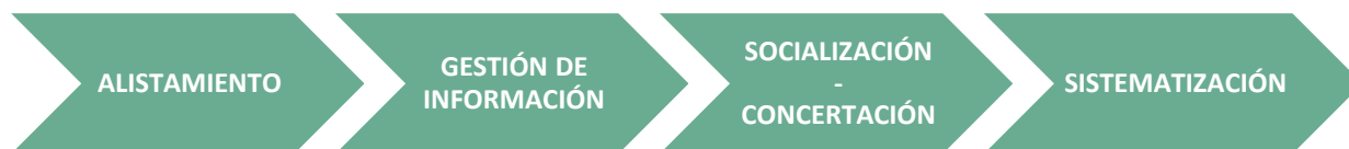
Gráfico 1. Proceso para elaborar el mapa de actores del sistema de administración del territorio

En el siguiente esquema se relacionan las fases del proceso para la construcción del mapa de actores del sistema de administración del territorio: