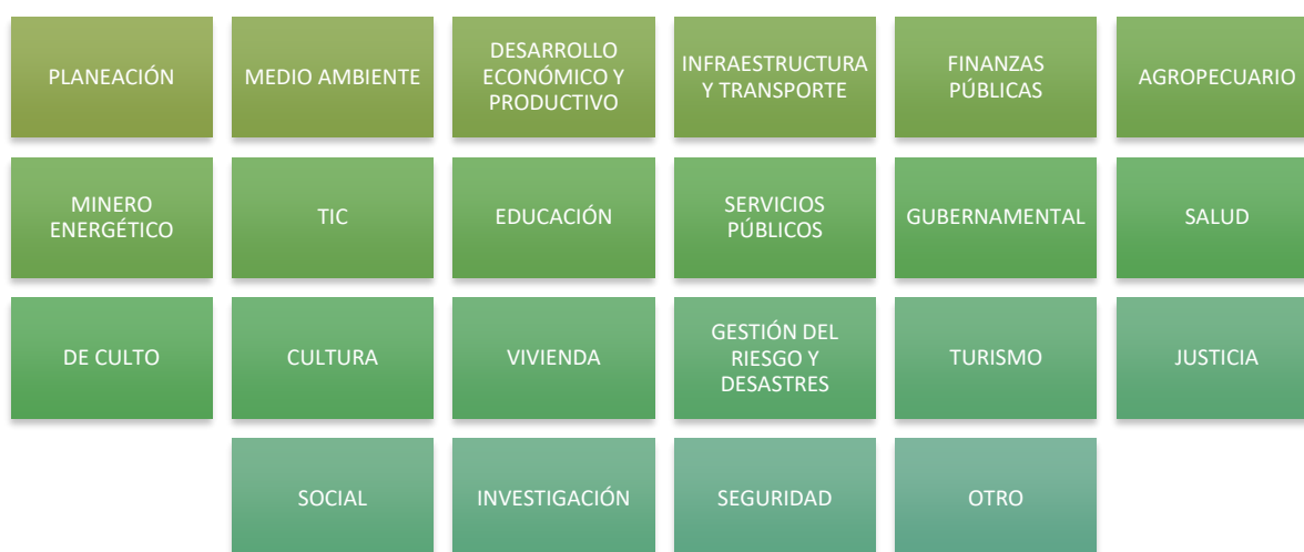
Gráfico 2. Clasificación de sectores según área de acción

En el gráfico 2 se establecen los sectores a los cuales podría pertenecer un actor dependiendo su ámbito y campo de actuación.